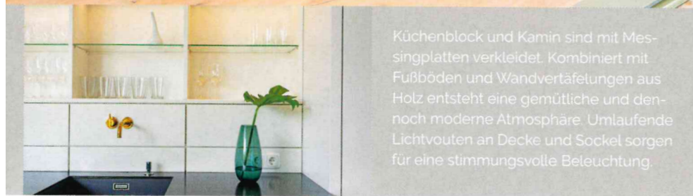
Küchenblock und Kamin sind mit Messingplatten verkleidet. Kombiniert mit Fußböden und Wandvertäfelungen aus Holz entsteht eine gemütliche und dennoch moderne Atmosphäre. Umlaufende Lichtvouten an Decke und Sockel sorgen für eine stimmungsvolle Beleuchtung.