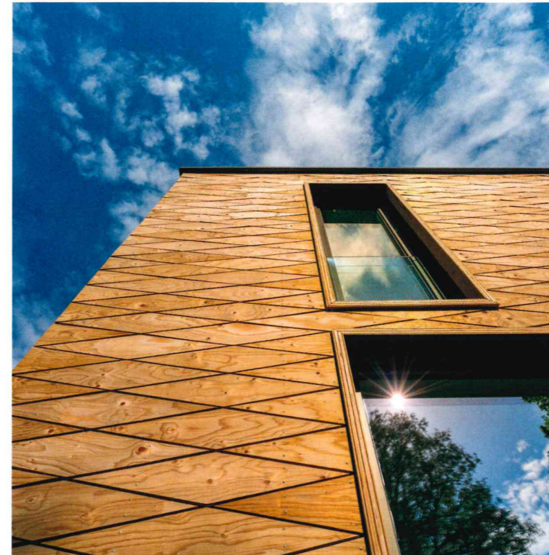
Die kesseldruckimprägnierten Holzrauten an der Fassade erinnern an Fischschuppen. Natürliche Vergrauung führt mit der Zeit zu einer silbrigen Färbung.

Der Eingang zum exklusiver ausgestatteten Zwilling, einem Ferienhaus für eine dreiköpfige